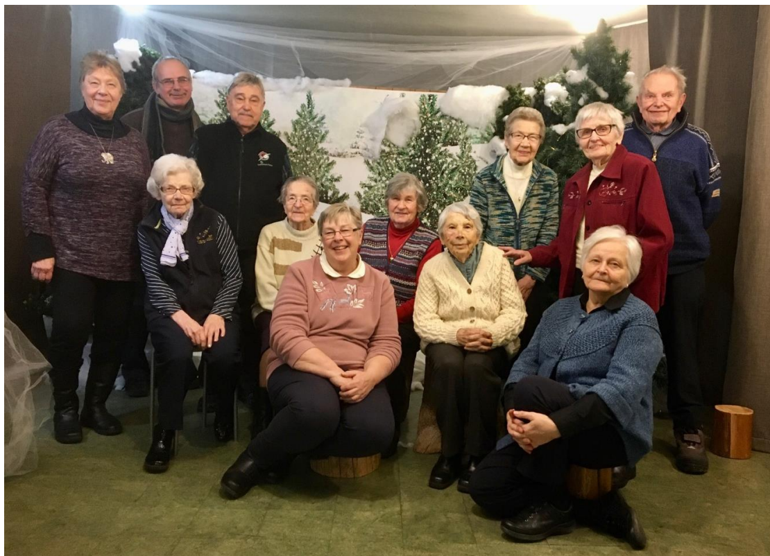
Ticības celsmes stundu grupa atrada brīnišķīgu vietu kur iepozēt!