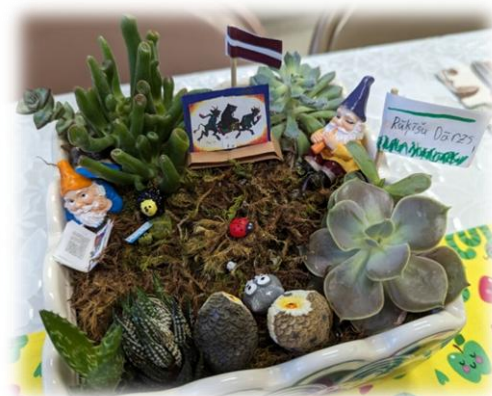
Latviskais rūķīšu dārziņš.

Skolas saime no sirds pateicas visiem, kuri atcerējās skolu un atbalstīja tās darbību šajā Draudzīgajā aicinājumā!