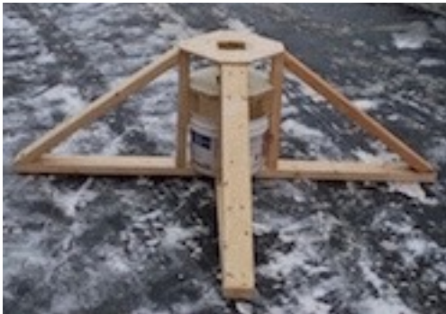
Speciāli būvētā "kāja" egli sagaida laukumā