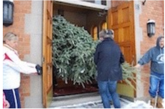
Pa priekšas durvīm egli ienes baznīcā