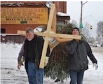
"Svinīgā gājienā" egli nes uz baznīcu