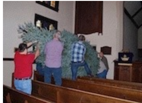
Ar daudzu vīru spēkiem egli uzstāda baznīcas stūrī