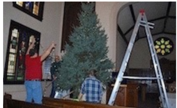
Egli ir jāizpušķo ar "sviecītēm"/lampiņām un "eņģeļu matiem"