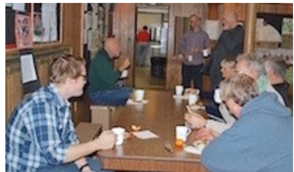
Pēc padarītā darba seko kafijas krūze ar uzkodām