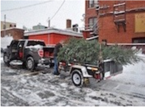
Dundas ielejā nocirstā egle tiek atvesta uz baznīcu