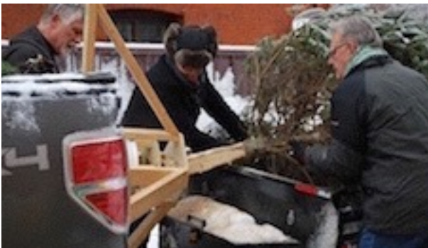
Egle tiek iemontēta speciālajā "kājā"