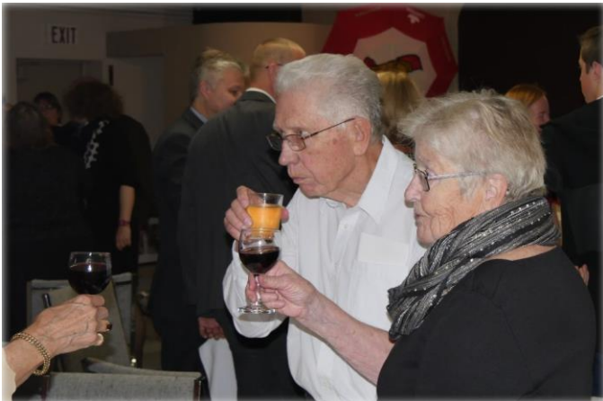
Iesākam sarīkojuma zālē ar tostu

mākslas izsoles, pīrāgu konkursi un skolas izlaidumi. Ir svinētas kāzas, iesvētības, kristības un vairāku organizāciju jubilejas.