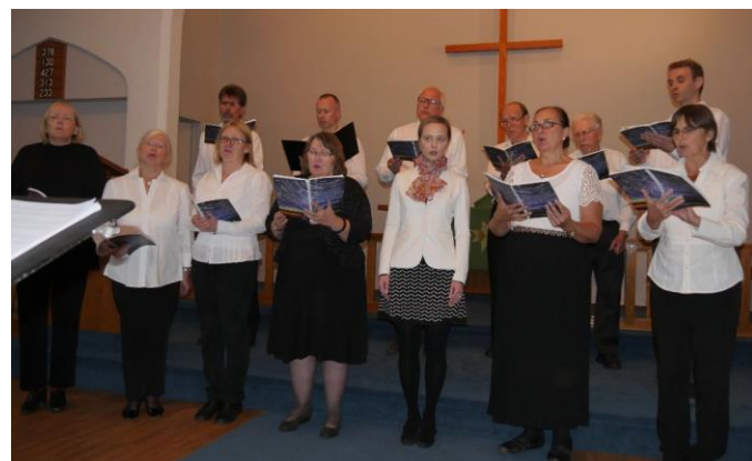
Koris uzstājas baznīcā

35 gadus nams ir piedzīvojis daudz jo daudzus sarīkojumus. Tos, kuras rīkoja draudze, bet arī tos, kurus rīkoja citas organizācijas. Biedrībai, DV, skolai, senioriem, dejotājiem, korim un vēstniecībai - visiem nams ir bijis atvērts kā mājas.