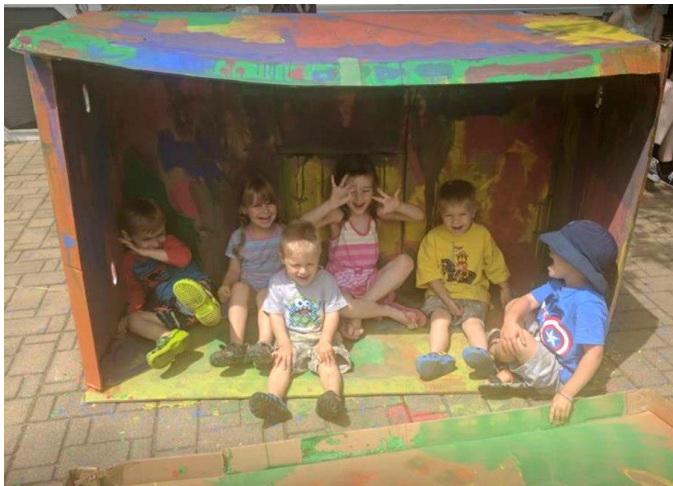
Tītariņi krāso savu māju

Pēc pēdējās nedēļas nodarbībām ievilkām elpu un pārrunājām, cik labi būs atpūsties. Īsu brīdi vēlāk likās tik kluss un arī bēdīgi, ka viss beidzās. Ingrīda Mazute