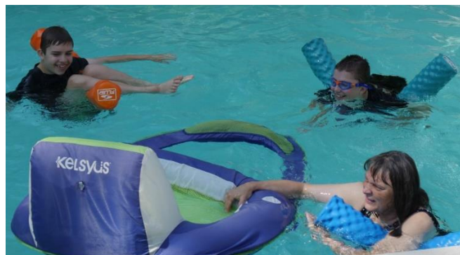
Saulē sasildīts peldbaseins noderēja lieliem un maziem