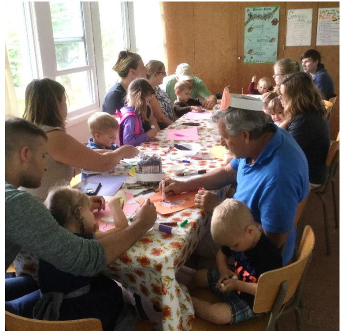
Tītariņi strādā rokdarbus