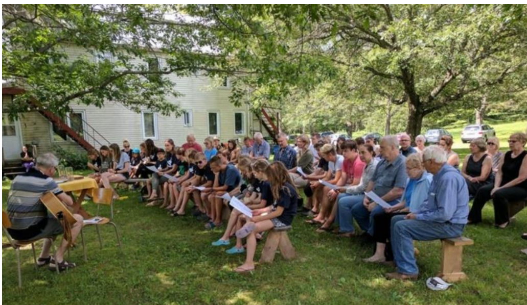
Svētbrīdis 16. jūlijā Tērvetē

Sprediķis galvenokārt bija par to, ka īstenība ir vairāk tā daļa, kas ir neredzama, ne kā tā, kas ir redzama. Ar lielu izteiksmi viņš stāstīja par lielu gleznu muzejā MOMA ( Museum of Modern Art, N.Y. ), kur viņš varēja saredzēt tikai lielu baltu audeklu, bet viens cits skatītājs esot bijis ļoti sajūsmots par šo mākslas darbu. Tas vīrs esot paskaidrojis, ka viņš slavēja nevis to, kas ir uzkrāsots, bet to, ko mākslinieks ir izlaidis. Tā pat varētu teikt, ka Tērvetē fiziski nav nekas sevišķs, bet tā sabiedrība un labā sajūta ir tas, kas cilvēkus pievelk.