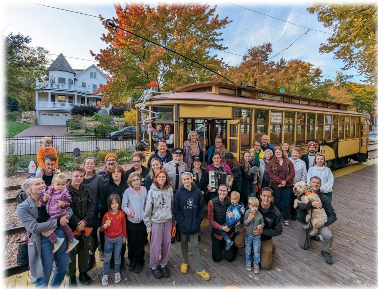
Kuplais dziedātāju pulks!

Bija prieks redzēt kuplo dziedātāju pulku (ap 40). Ģimējs prieks bija par ģimenēm ar bērniem un jauniešiem - aug jaunā dziedātāju maiņā! Tramvaja braucienā līdzi devās arī 2 sunīši. Tie gan no dziedāšanas atturējās 😊