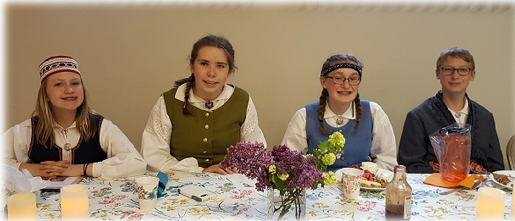
Absolventi pie svētku galda.

Skolas saimes vārdā sveicu absolventus ar viena ceļa noslēgumu un latviešu sabiedrības vārdā aicinu – turpiniet latvietības ceļu: priecāsimies jūs redzēt sarīkojumos, baznīcā, deju mēģinājumos, korī! Nāciet pulkā!