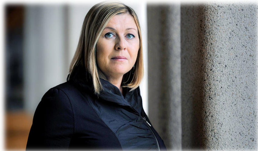
A creative reckoning. Nora Ikstena.

This is not a comfortable novel; its determination to make symbolic capital of every event is as relentless as the events themselves are saddening. Yet its powerful evocation of an era that seems almost unimaginable now, but which could all too easily return if Europe fails to defend the hard-won freedoms of its nations, makes it a valuable, even an important one.