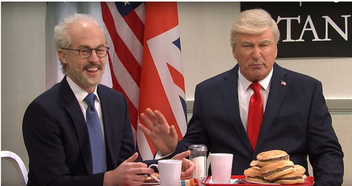
Alec Baldwin's Trump is told to go sit at the "losers" table with Latvia – Alex Moffat portraying President Egils Levits.