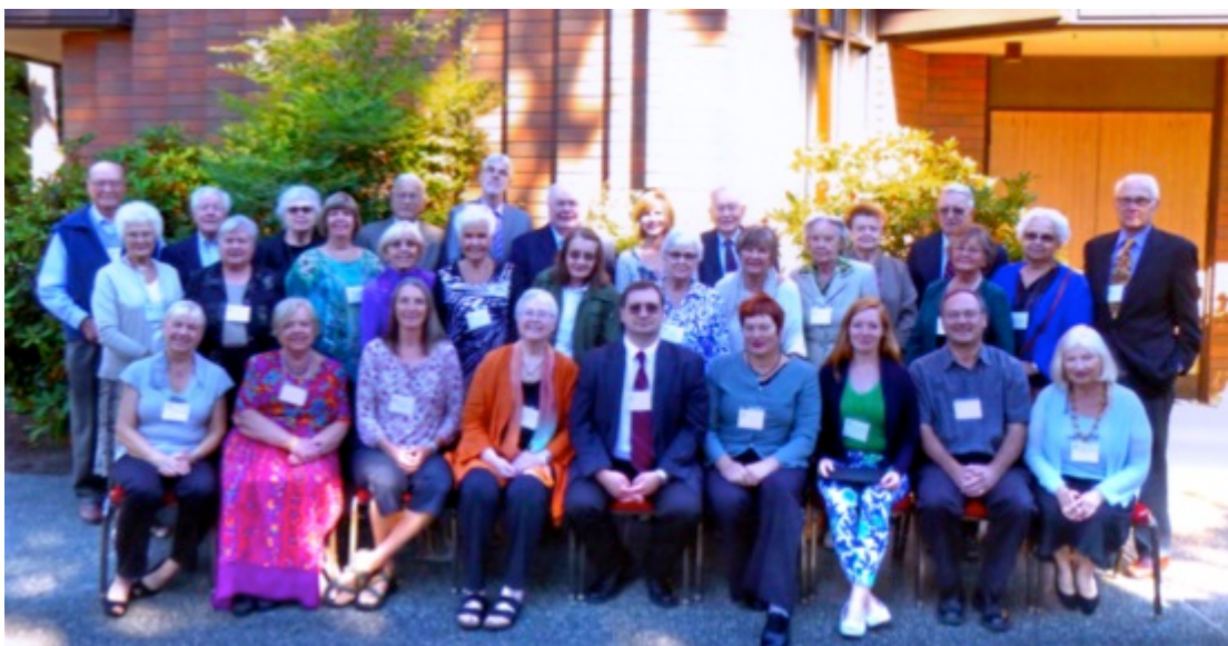
LELBA Rietumu apgabala konferences dalībnieki