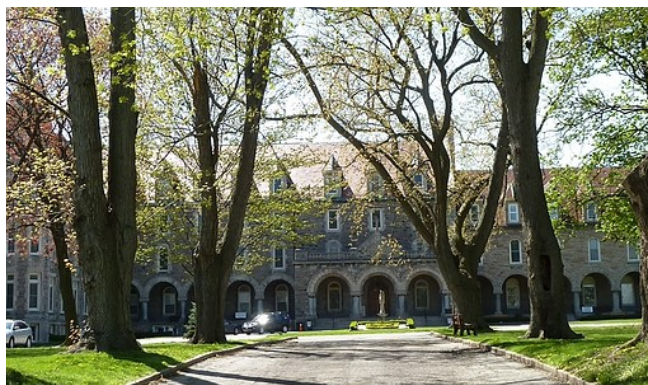
Mount Carmel Spiritual Center, kur notiks Sinode 2017.g.