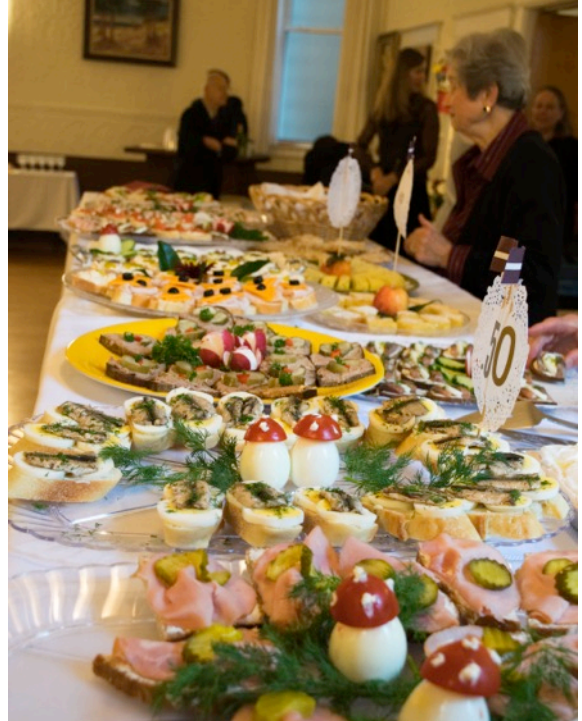
Pa labi: Dāmu komitejas sarūpētā svētku bufete