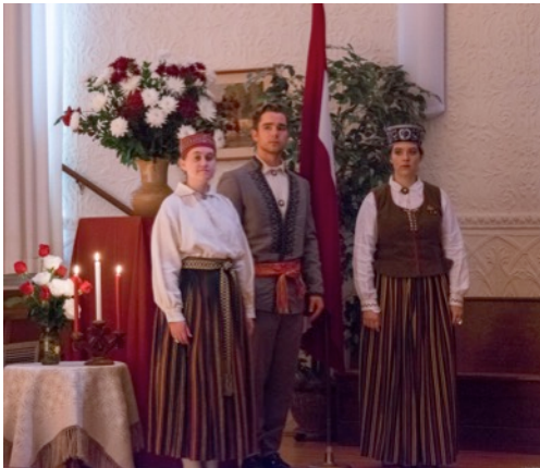
Latvijas karoga goda sardze.