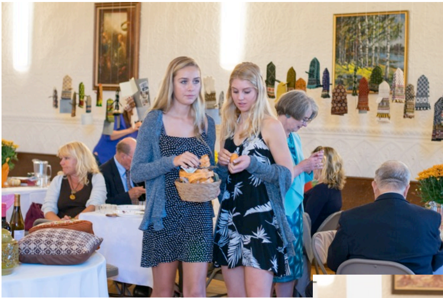
Pa kreisi: Draudzes jaunā paaudze tirgo loterijas biļetes