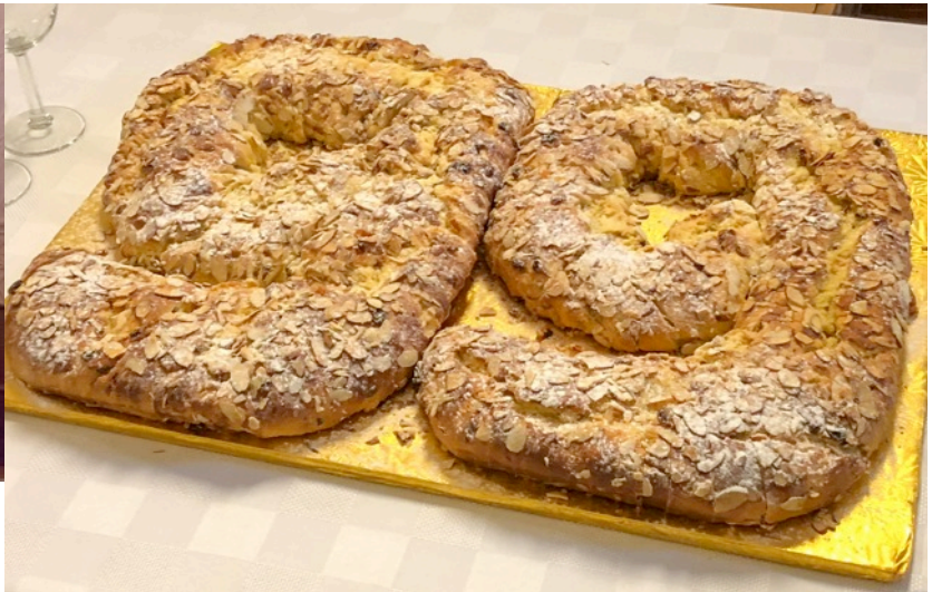
Anitas Greenband ceptais svētku kliņģeris